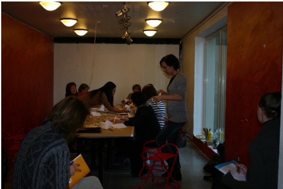
Näyttelyä valmisteltiin Omatila-galleriassa. Museologian opiskelijat havainnoivat tilannetta sivusta.

Lähtökohtana resepteistä puhumiseen ja teemoittelun luomiseen oli ihmettely: Song poimi pöydältä yhden reseptin kerrallaan ja kertoi mitä siinä näki. Ryhmä sai vastata hänen esittämiin väittämiin ja kysymyksiin, jotka luonnollisesti rakentuivat korealaiselle tulkintahorisontille. Tästä syntyi hyväntuulinen keskustelu, jossa mielen reseptien sisältöä ja kuvakieltä avattiin yhteisesti. Kerrontaa jäsentävät teemat syntyivät miltei huomaamatta. Keskustelun jälkeen reseptit oli ryhmitelty seuraaviin kategorioihin: muistin ruoka, hyvän hetken ruoka, iloruoka, aikaruoka, vuodenaikaruoka.