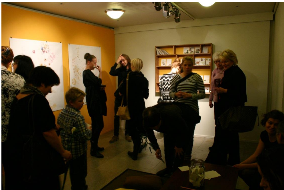
Avajaisillan tunnelmia Mieleni maut -näyttelyssä.

Maryn performanssi herätti kiinnostusta ja näyttelytilassa oli kuhinaa koko illan.