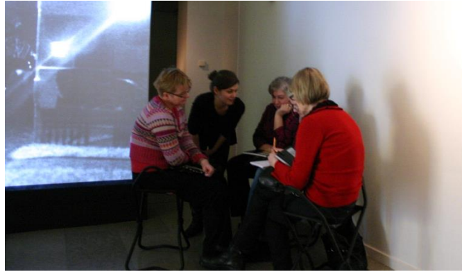
Pienryhmässä pureuduttiin pohtimaan videoteoksen mahdollisia ja mahdottomia tapahtumia.

Kiersin jokaisen ryhmän luona kertaamassa tehtävän ohjeistuksen ja tarjoamassa apua. Ryhmät tuntuivat olevan työn touhussa, mutta purkuvaiheessa tunnelmat olivat osalla tyytymättömät. Jostakusta tuntui, että ohjaaja tavoitteli tehtävällä ”jotakin suurempaa”, mikä luonnollisesti hankaloitti tekemistä. Muistutin ryhmää siitä, että yhtä oikeaa vastausta ei ole. Sovimme yhteisesti siitä, että ohjaaja keskittyy jatkossa tehtävänantojen selkiyttämiseen. Vastavuoroisesti ryhmä lupasi sanoa rohkeasti ääneen, mikäli jokin asia olisi epäselvä. Epävarmuuden tunteita varmasti syntyisi jatkossakin, mutta ohjaajan tehtävä olisi varmistaa, ettei turvallisuuden ja luottamuksen kokemus kuitenkaan kärsisi. Sopimus vakautti yhteistyömme pohjaa.