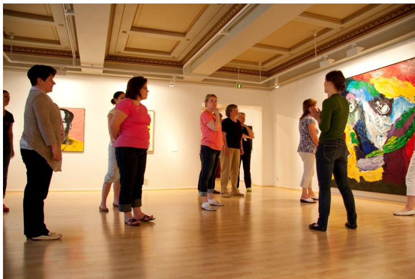
Karel Appelin värikylläinen teos tuntui myös iholla.

Näyttelytilassa kokoonnuimme ensimmäisellä tapaamisella tutuksi tulleen Karel Appelin teosten ääreen. Pyysin ryhmää kiinnittämään huomiota kahden esillä olevan öljyvärimaalauksen pintaan. Maalia oli paksult kankaan pinnalla ja taiteilijan kädenjälki näkyi materiaalissa. Appelin teokset eivät suoraviivaisesti esitä mitään, mutta teosten nimet ( Ymmällään maisemassa; Kasvot – maisemassa ) saattavat ohjata katsomiskokemusta. Yksi naisista sanoi, että ei esittävän teoksen ääressä hän usein turhautuu ja siirtyy pois. Abstrakti maalaus ei siis tarjoa kosketuspintaa tulkinnalle. Huomio oli oiva tarttumapinta käsillä olevaan harjoitukseen. Kysyin ryhmältä, voisiko abstraktista taiteesta löytää muita tulokulmia, kuin havaintotodellisuudesta poimitun aiheen etsiminen? Voisiko liike olla lähtökohta Appelin työn avaamiseen? Kerroin ryhmälle, että Appelin mukaan maalaamisen tulisi noudattaa tiettyä leikkillisyyttä. Hänen mukaansa luovuus katoaa, mikäli tekeminen ei ole vapaata ja ennakkoluulotonta. Ajatus ohjasi meitä seuraavaan harjoitukseen, jossa teimme liiketoisinnon Appelin maalauksesta: maalasimme öljyvärityön käsillämme ilmaan. Teimme toisesta teoksesta tuntotulkkauksen, jossa tehtävänä oli pohtia, miltä teoksen värit tuntuisivat iholla. Jokainen sai ensin kokeilla värejä omalla ihollaan ja sen jälkeen teimme tuntotoisinnon parin selkään.