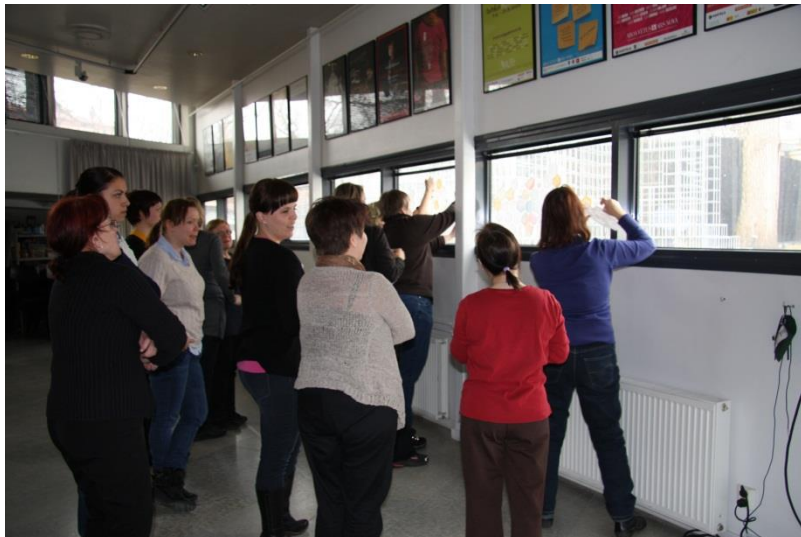
Yksittäiset polut kasvoivat iltapäivän aikana yhteiseksi valoreitistöksi.

Lopuksi kysyin, mitä mieltä ryhmä oli käsillä tekemiseen keskittyneestä tapaamisesta. Mieli-piteet jakautuivat puolesta ja vastaan: Katselen mieluummin kuin teen itse, mainitsi yksi osallistuja. Toisen mielestä tekeminen oli helpompaa kuin näyttelytilassa oleminen (ei tarvinnut miettiä niin paljon, joten tapaaminen tuntui kevyemmältä). Ryhmä piti tekemisen tahtia sopivana (kiireen tuntua ei ollut ja iltapäivä kului huomaamatta). Lopussa muistutin iltapäivän avanneesta mielialajanasta ja pyysin jokaista kirjoittamaan päiväkirjaan, millä mielellä he lähtevät museosta.