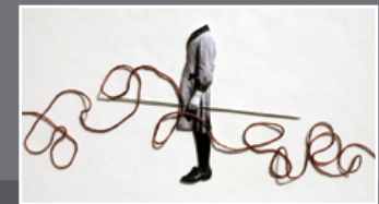
Улла Йокисало, Ностальгичик игл, вариация 2, 2010